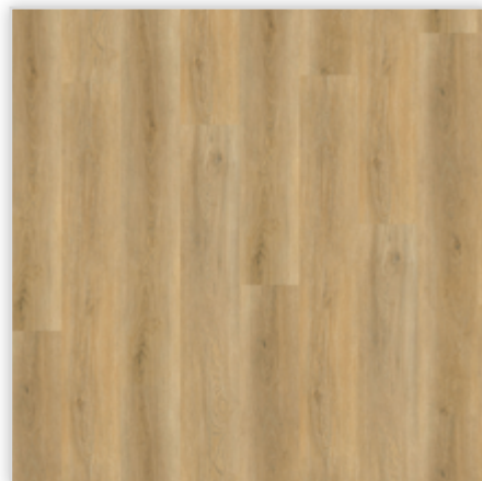
Kolekcja wineo 600 wood XL w wersji bezklejowej Connect, dekor #LondonLoft, symbol RLC193W6. Wymiary [mm]: 1507/234/5. Wzór: pełna deska, struktura Synchron, warstwa użytkowa 0,4 mm, klasa użytkowa 23/32. Podłoga dostępna również w wersji klejowej.