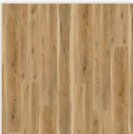
Kolekcja wineo 600 wood XL w wersji na klej, dekor #SydneyLoft, symbol DB194W6. Wymiary [mm]: 1505/235/2. Wzór: pełna deska, struktura Synchron, warstwa użytkowa 0,4 mm, klasa użytkowa 23/32/41. Podłoga dostępna również w wersji bezklejowej Connect.