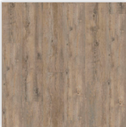
Kolekcja wineo 400 wood w wersji na klej, dekor Embrace Oak Grey, symbol DB00110. Wymiary [mm]: 1200/180/2. Wzór: pełna deska, głęboka struktura drewna, warstwa użytkowa 0,3 mm, klasa użytkowa 23/31. Podłoga dostępna również w wersji bezklejowej Connect i Multi-Layer.