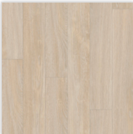
Kolekcja wineo 800 craft w wersji na klej, dekor Infinity Light Solid, symbol DB00074. Wymiary [mm]: 914,4/101,6/2,5. Wzór: pełna deska, wyczuwalna struktura drewna, warstwa użytkowa 0,55 mm, klasa użytkowa 23/33/42.