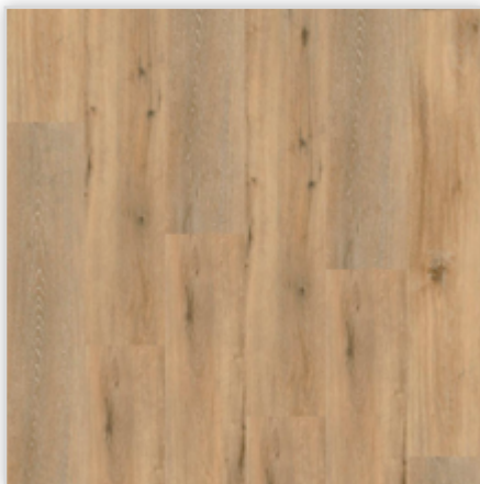
Kolekcja wineo 400 wood w wersji Multi-Layer, dekor Adventure Oak Rustic, symbol MLD00111. Wymiary [mm]: 1222/182/9. Wzór: pełna deska, głęboka struktura drewna; warstwa użytkowa 0,3 mm, klasa użytkowa 23/31. Podłoga dostępna również w wersji klejowej i bezklejowej Connect.