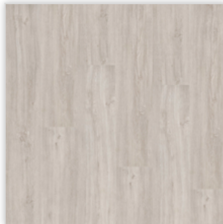
Kolekcja wineo 400 wood XL w wersji bezklejowej Connect, dekor Ambition Oak Calm, symbol DLC00122. Wymiary [mm]: 1507/235/4,5. Wzór: pełna deska, struktura Synchron, warstwa użytkowa 0,3 mm, klasa użytkowa 23/31. Podłoga dostępna również w wersji klejowej i Multi-Layer.