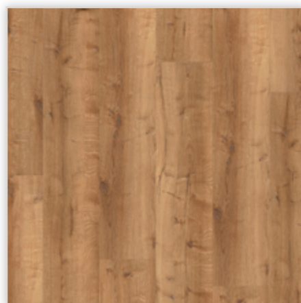
Kolekcja wineo 400 wood XL w wersji na klej, dekor Comfort Oak Mellow, symbol DB00129. Wymiary [mm]: 1505/235/2. Wzór: pełna deska, struktura Synchron, warstwa użytkowa 0,3 mm, klasa użytkowa 23/31. Podłoga dostępna również w wersji bezklejowej Connect i Multi-Layer.