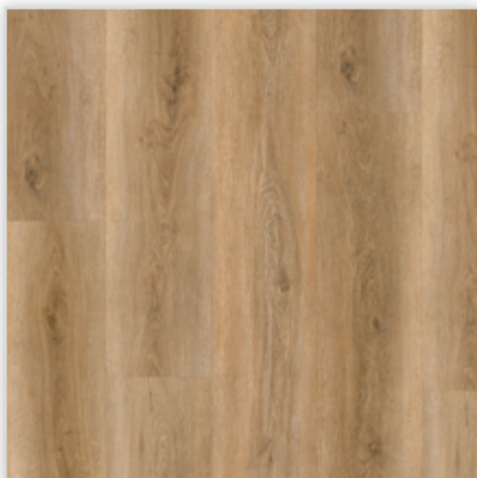
Kolekcja wineo 600 wood XL w wersji na klej, dekor #AmsterdamLoft, symbol DB195W6. Wymiary [mm]: 1505/235/2. Wzór: pełna deska, struktura Synchron, warstwa użytkowa 0,4 mm, klasa użytkowa 23/32/41. Podłoga dostępna również w wersji bezklejowej Connect.